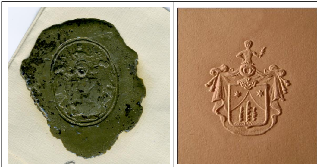
Сургучный оттиск (ОР ГТГ, ф. 44/1850.)

«Если придёт тётя Юля, то не забудь попросить её достать из Риги наш герб (просто сургучный оттиск, но отчётливый)...»