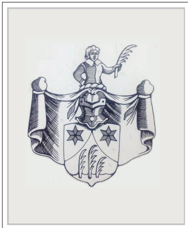
Н.К. Рерих. Герб. Бумага, тушь, перо. 24 x 30 см. (Государственная Третьяковская галерея, Арх. Гр-2382).